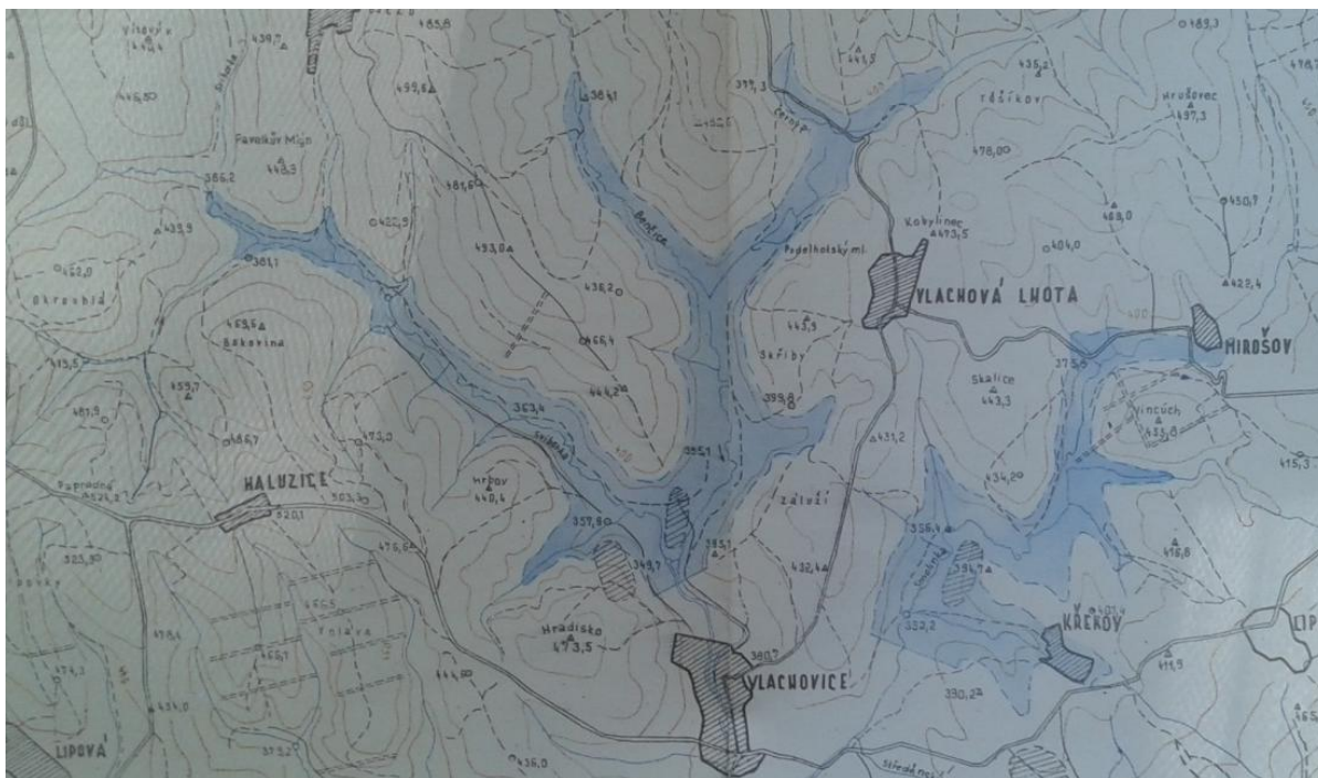
Obr. 02: Dříve zvažovaný rozsah VD Vlachovice [41]